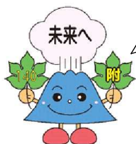
記念マスコット 「さくら」

桜島の体は、ふるさとを愛する気持ちを表し、左手の校章で附属小への誇りを、右手の140には、140年の歴史と伝統をこれからもつなげていこうと強い意志を込めています。さらに、赤、黄、桃、青、緑の五色には、みんなが未来に向けて成長し大きく羽ばたいて欲しいという願いが込められています。