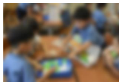
【ボールが正しくゴールするよう、ピースの配置の工夫を話し合う様子】

本校では、のぞみタイム（総合的な学習の時間、3～6年生）及び朝の活動「ロジックタイム（1～4年生）」、クラブ活動などの時間において、「プログラミング教育」に取り組んでいます。これらの中で、7月からスタートした「ロジックタイム」では、ピースの種類や置く場所を考えながらボールを正しくゴールさせるパズルを使った活動や、画面上のロボットが正しくゴールできるように命令していくアプリを使った活動を行いました。