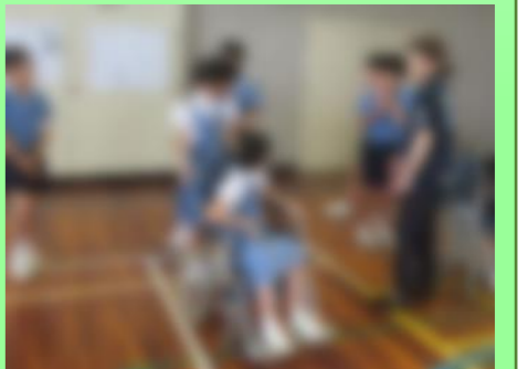
【車いすに乗った立場からの感想を基に、押す人の配慮の必要性を話し合う様子】

子どもたちは、体験を通して、「普段通りの間隔で行動しようとしても、体が思うように動かなかった。」「普段気にならない少しの段差も大変だった。」というように、普段の自分とは異なる立場に身を置くことによる新たな気付きを得ることができました。また、それらの気付きを交流し合う中で、子どもたちは、「高齢者にとって、過ごしやすい町になっているのだろうか。」など、調べていきたい課題を明らかにすることができました。