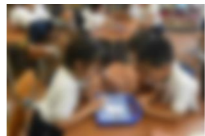
【画面上のロボットが正しくゴールできるように命令を吟味し合う様子】

活動の中で、子どもたちは、試行、吟味、修正を何度も繰り返しながら取り組むことができました。そして、正解に辿りついたグループからは大きな歓声が上がりました。