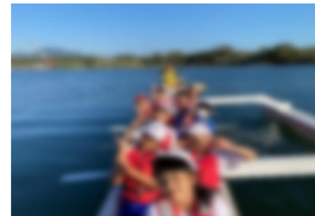
【チームみんなで力を合わせてこいだカヌー体験】

11月20日～22日、5年生の自然教室がありました。5年生の子どもたちは、1泊2日の自然教室でのカヌー体験、野外炊飯などの活動を通して、南薩の自然に親しみました。子どもたちが特に素晴らしかったのは、野外炊飯後の片付けや自分たちが使った場所の清掃時に見せた姿、仲間とカヌー体験で声を合わせ協力した姿です。子どもたちのしおりやあしあとに書かれた感想の一部を紹介します。